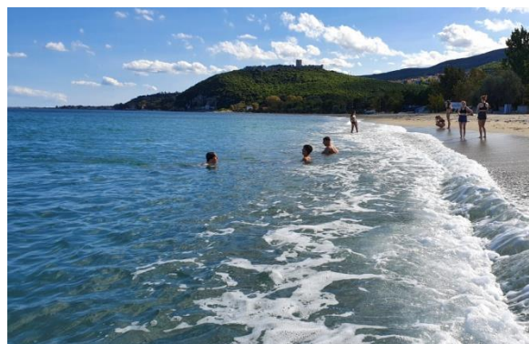
Plaża przy hotelu, z XIIIw. zamkiem

Nie był to wyjazd czysto „wakacyjny”. Każdego dnia mieliśmy zajęcia, w ramach których przygotowywaliśmy ulotki związane z Grecją według naszego własnego pomysłu. Tworzyliśmy własne mini gry w programie Scratch.