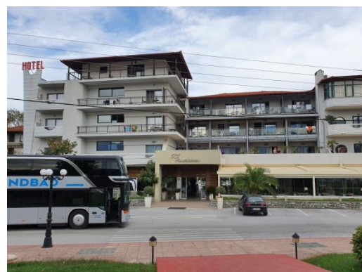
Nowoczesny hotel SAN PANTELEIMON z którego widać w oddali górę Olimp