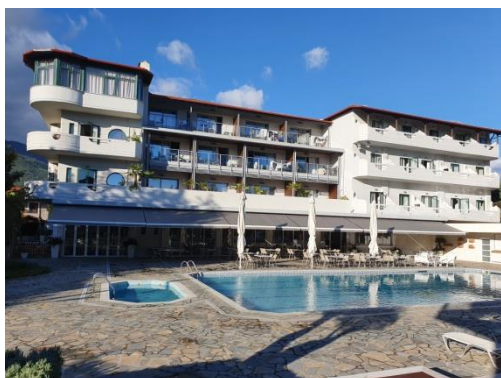
Hotel (widok od wschodu)